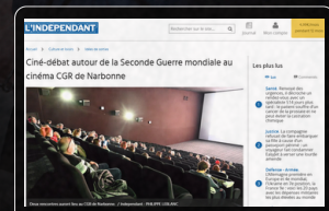
L'INDÉPENDANT ANIMATION CINÉ-DÉBAT