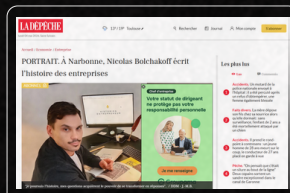
LA DÉPÊCHE HISTORIEN DES ENTREPRISES