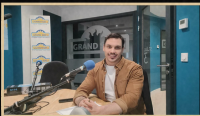
GRAND SUD FM PROMOTION ÉVÈNEMENT CULTUREL