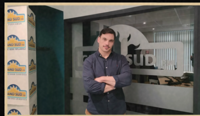
GRAND SUD FM PROMOTION ÉVÈNEMENT CULTUREL